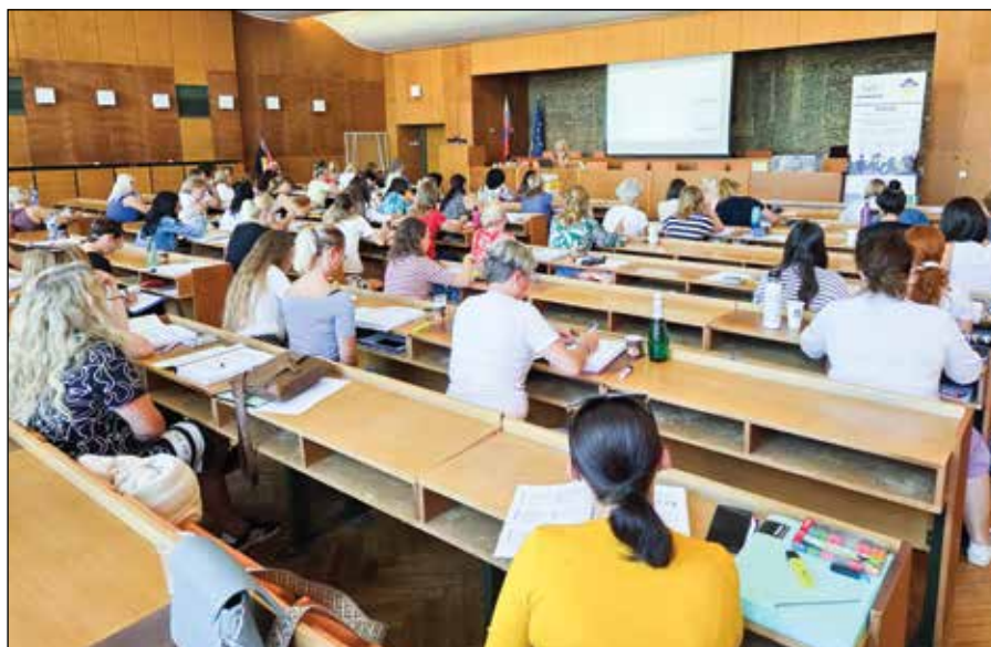
■ Po dvojročnej prestávke sme v septembri 2025 realizovali 5-dňový akreditovaný kurz Podvojný účtovníctvo pre obce, mestá, VUC a ich ROPO, ktorého odbornou garantkou je Ing. Urbanová. 70 účastníkov úspešne zvládlo absolvovať kurz i s osvedčením, ktorému predchádzalo úspešné absolvovanie testu.

málne stretnutia a výmenu skúseností, nadviazanie a upevnenie kontaktov. Ponuka je pripravená vždy; jej realizácia však závisí od záujmu účastníkov, keďže zachovanie dostupných cien je možné len pri dostatočnej účasti.