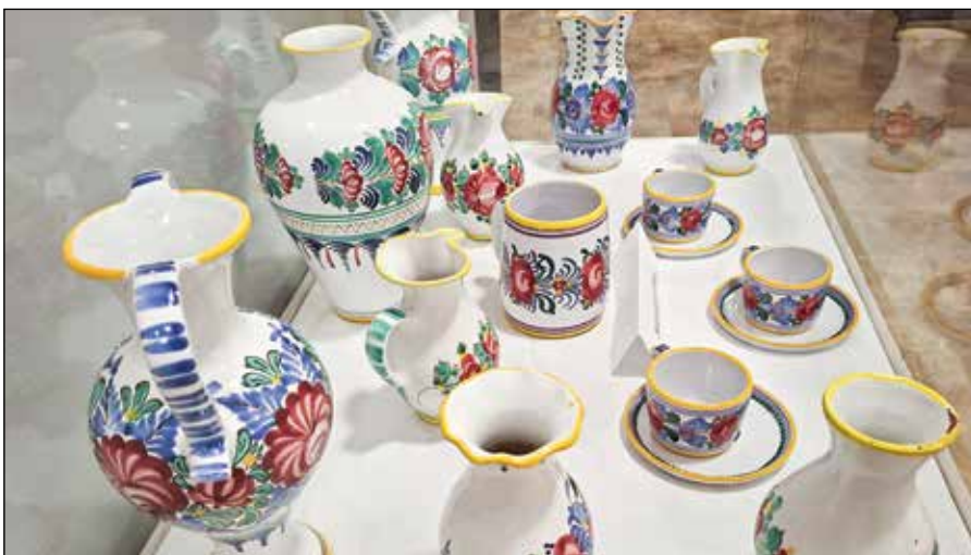
■ Keramika sa rodila už v časoch osídlenia Siladic Slovanmi