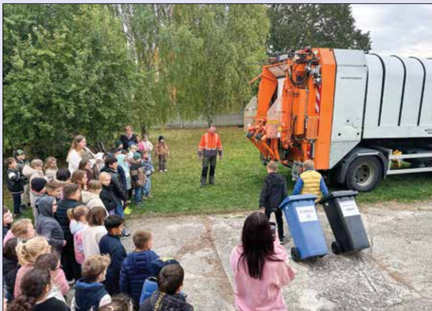
■ Interaktívne vzdelávanie na školách – nakladanie s odpadmi (ZŠ Jelka)

Zvlášť významné je aj spracovanie kuchynského odpadu, ktorý je z hľadiska hygieny a logistiky náročnejší. Skutočnosť, že tvorí približne desatinu spracovaného objemu, ukazuje, že systém zberu BRKO je stabilizovaný a obyva-