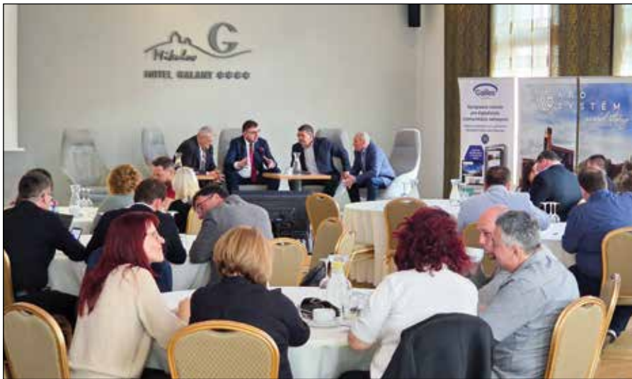
■ Pracovné stretnutie 25. – 26. marca 2025 Spoločne pre regióny v Mikulove (CZ), ktoré sa uskutočnilo na pozvanie našich partnerov GALILEO Corporation, T-MAPY a ARD SYSTEM. Zúčastnili sa štatutári obcí a miest ZMO, región JE Jaslovské Bohunice, RZ Stredné Považie a RZ Podunajskej oblasti.

Aj keď samosprávy konsolidačný balík ako celok odmietli, v prípade jeho prijatia požadovali zapracovanie nasledujúcich požiadaviek: v zákone jednoznačne zadefinovať dočasnosť prijímaných opatrení len na roky 2026 a 2027, s automatickým návratom na pôvodný podiel vo výške 55,1 % pre obce a 30 % pre samosprávne kraje od roku 2028; férové vyriešenie financovania valorizácie miezd v regionálnom školstve, konkrétne súkromných a cirkevných škôl a školských zariadení od roku 2026 v podielovej dani samospráv; nutnosť zabezpečiť väčšiu flexibilitu pri použití rezervných fondov obcí, miest a krajov, a to natrvalo. Za nevyhnutnosť ZMOS považuje aj to, aby vláda zmenila zákon o dani z nehnuteľností – I sadzbu dane za nebytové priestory na druhom a ďalšom podlaží, ktorá je fixne určená v zákone a nezvyšovala sa 21 rokov. Zatiaľ čo bežným obyvateľom sa dane pravidelne zvyšujú, investičné fondy a majitelia veľkých kancelárskych budov už viac ako dve desaťročia platia rovnakú sadzbu 10 Sk/m 2 (0,33 €/m 2 ). Ide o jedinú sadzbu dane z nehnuteľností, ktorú nemôžu mestá a obce upravovať vo svojom VZN. Rovnako dôležité je, aby boli samosprávam poskytnuté jednoznačné pravidlá pri uplatňovaní tzv. dlhovej brzdy. Súčasné nastavenie je pre obce, mestá a kraje nejasné a nepredvídateľné, čo zvyšuje riziko pri príprave rozpočtov a investičných plánov na budúce obdobia.