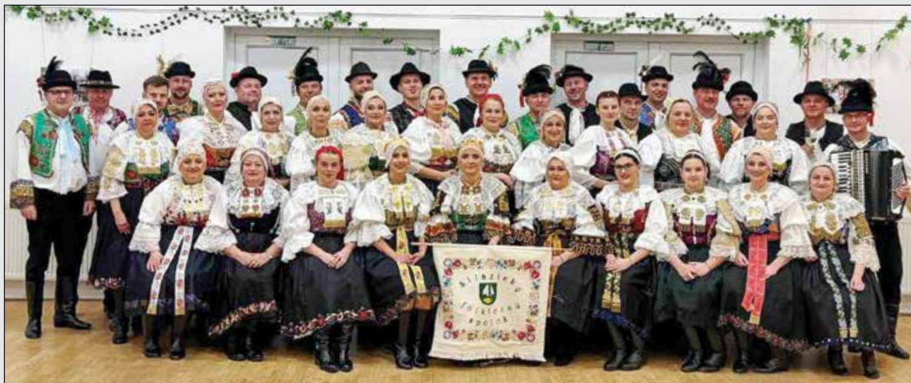
■ Členovia Siladického folklórneho spolku a ostatní milovníci tradícií v slávnostných krojoch počas Fašiangového plesu 2026