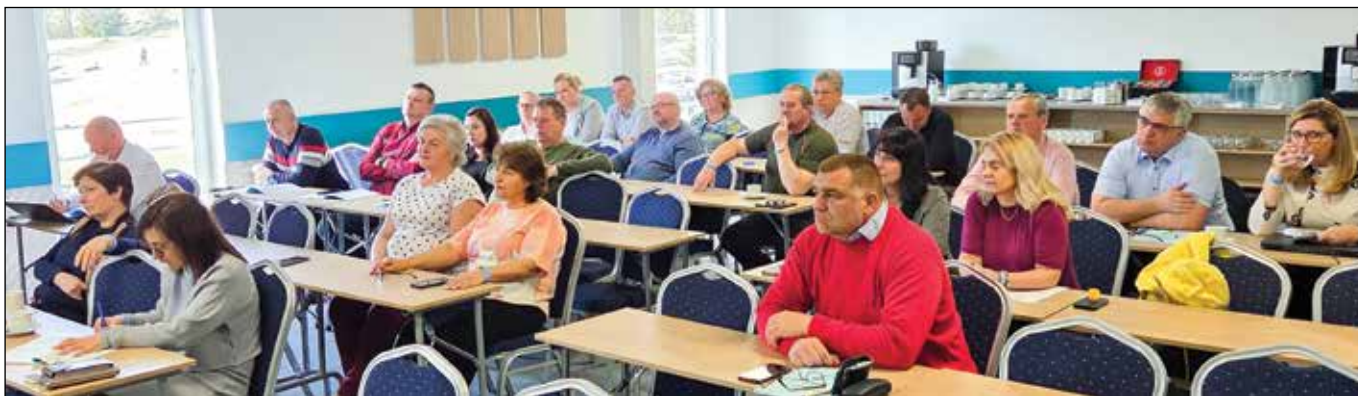
■ Pracovné stretnutie starostov a primátorov 7. – 9. apríla 2025, Nový Smokovec, Hotel Átrium. Priestor na vzdelávanie i diskusiu s lektormi i kolegami.

„Celoživotné vzdelávanie je minimálnou požiadavkou pre úspech v akejkoľvek oblasti.“