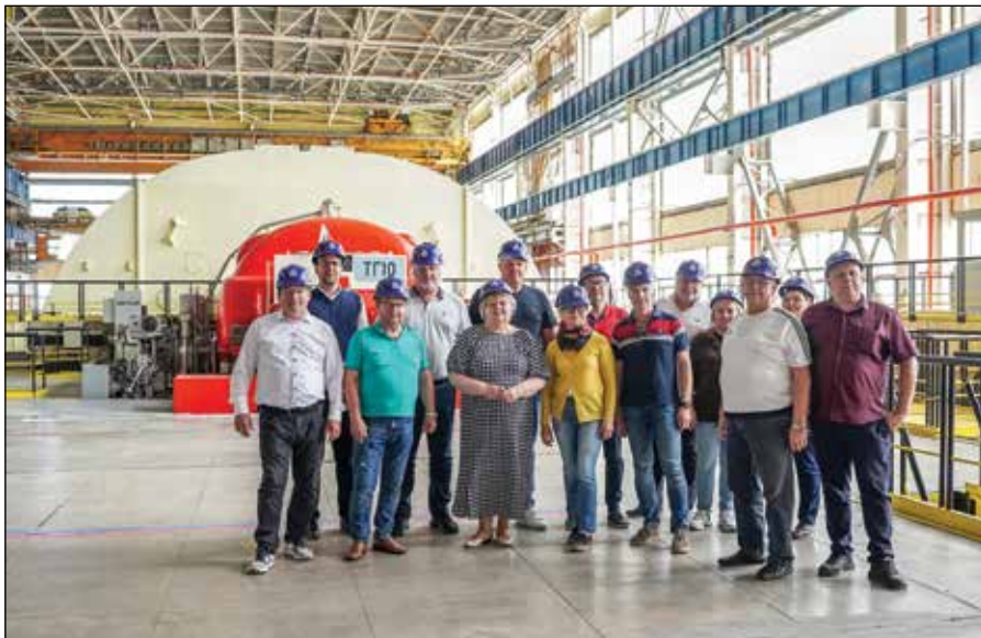
■ Členovia Občianskej informačnej komisie na pracovnej ceste v Bulharsku v máji 2025. Na fotografii v jadrovej elektrárni Kozloduj na severozápade Bulharska, v meste Kozloduj na brehu rieky Dunaj.

V dňoch 12. až 16. mája 2025 sa členovia OIK Bohunice zúčastnili na odbornej pracovnej ceste do Bulharskej republiky, ktorej cieľom bola výmena skúseností v oblasti prevádzky,