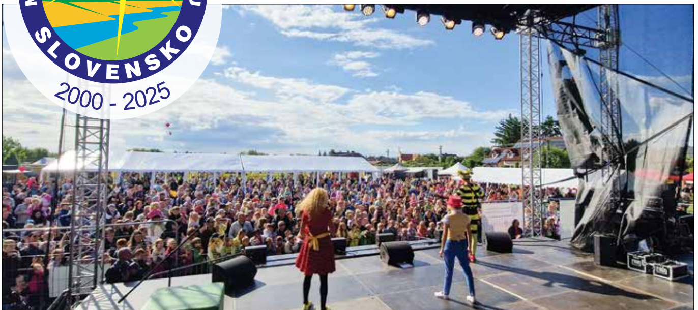
■ Na oslavách Mikroregiónu nad Holeškou v máji 2025 na futbalovom ihrisku v Rakoviciach v rámci programu pre deti vystúpili i Smejko a Tanculienka, počasie prišlo návštevníkom i účinkujúcim a všetci si program užili naplno