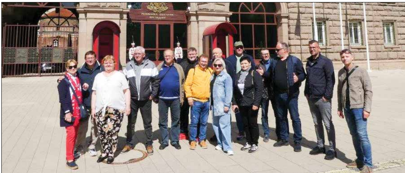
■ Súčasťou cesty OIK do Bulharska bolo aj poznávanie bulharského kultúrneho dedičstva, ktoré pomohlo účastníkom lepšie porozumieť spoločenskému kontextu krajiny. Delegácia navštívila historické centrum Sofie a významné pamiatky ako Rílský kláštor, ktorý je zapísaný v Zozname svetového dedičstva UNESCO.

lu. Hostiteľom bola spoločnosť JAVYS, ktorá pripravila odborný program pozostávajúci z prezentácií zástupcov JAVYS, JESS a Slovenských elektrární. Účastníci sa oboznámili s aktuálnymi aktivitami, projektmi a plánmi do najbližšieho obdobia, pričom významnou časťou programu bola aj výmena skúseností medzi slovenskými a českými samosprávami.