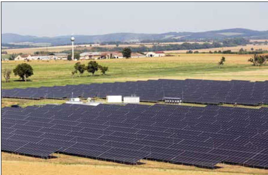
■ Fotovoltaická elektrárň FVE 2 Bohunice

V roku 2026 pozývame darcov krvi zúčastniť sa na darcovstve krvi 5. mája a 28. októbra. - AB -