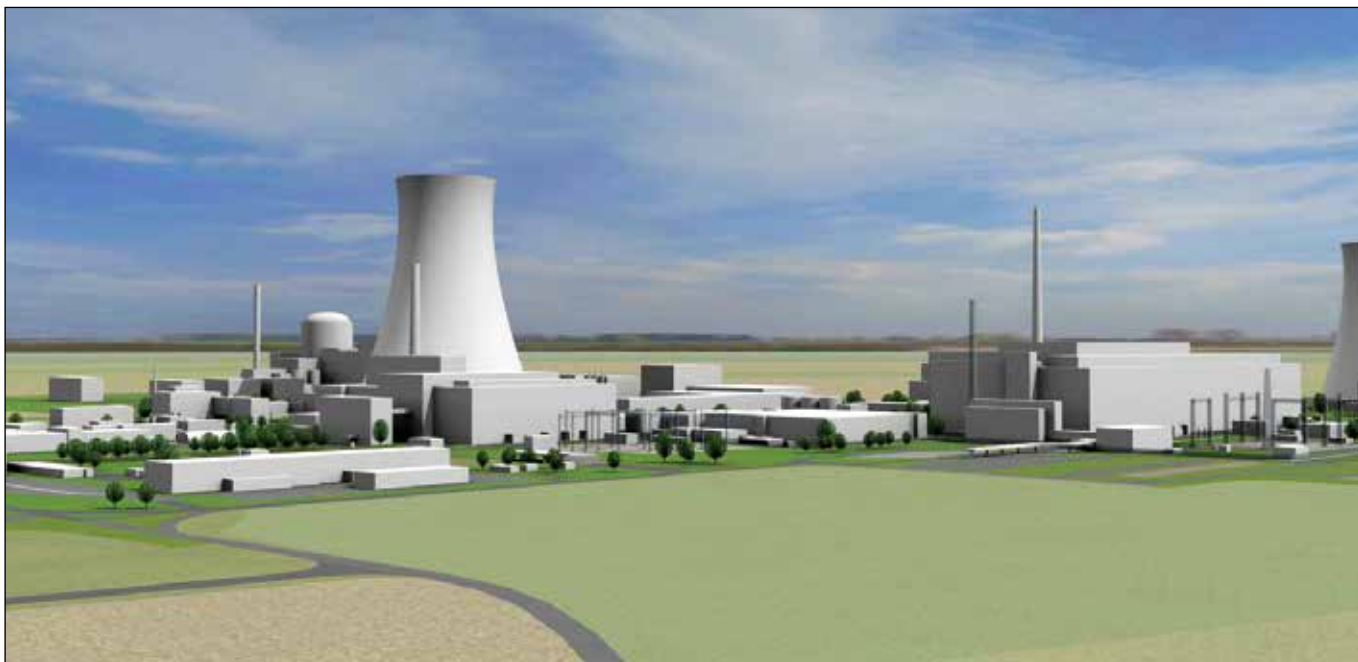
■ Vizualizácia nového jadrového zdroja

443/2025, na základe ktorého došlo k podpísaniu „Dohody medzi vládou Slovenskej republiky a vládou Spojených štátov amerických o uľahčení spolupráce na projekte jadrovej elektrárne Jaslovské Bohunice a na civilnom jadrovom programe v SR.“ Táto dohoda vytvára rámec pre odbornú spoluprácu, výmenu skúseností a podporu rozvoja jadrovej energetiky v súlade s najvyššími bezpečnostnými, technologickými a environmentálnymi štandardmi. Do konca roka 2026 by sa malo zároveň rozhodnúť aj o spôsobe financovania a zabezpečení prostriedkov na výstavbu nového jadrového zdroja.