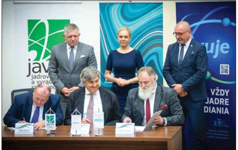
■ Spoluprácu spoločností JAVYS, VÚJE a newcleo osobne podporil aj premiér Robert Fico a ministerka hospodárstva Denisa Saková

Výstava bola zároveň príležitosťou na stretnutia s existujúcimi aj potenciálnymi partnermi a na diskusiu o budúcich projektoch v oblasti vyradovania a spracovania rádioaktívnych odpadov. Veľký záujem vzbudila aj téma bezpečnej prepravy jadrových materiálov, kde spoločnosť prezentovala vysoké bezpečnostné štandardy a skúsenosti s medzinárodnou koordináciou.