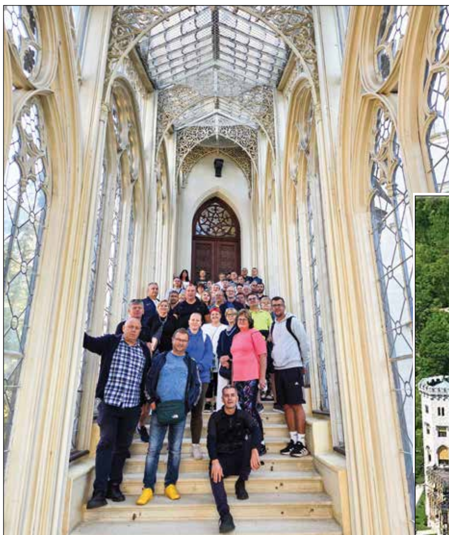
■ Účastníci pracovnej cesty absolvovali i komentovanú prehliadku zámku Hluboká, ktorý patrí k turisticky najatraktívnejším pamiatkam v rámci CZ. Za svoju súčasnú podobu vďaka zámok rodu Schwarzenberk. Kúsok Anglicka uprostred Čiech – i tak popisujú zámok Hluboká, ktorý dnešnú podobu získal v 19. storočí po neogotickej prestavbe.

nantu mesta Černá věž postavenú v 16. storočí a "vybehli" po 225 schodoch hore, aby si pozreli klenot Českých Budějovic – historické jadro a námestie Přemysla Otakara II, ktoré je so svojim štvorcovým tvarom a rozmermi 133 x 133 metrov jedným z najväčších námestí v strednej Európe. Neobišli ani prehliadku pivovaru Budvar, ktorý svoj zlatistý mok exportuje do viac ako 70 krajín sveta.