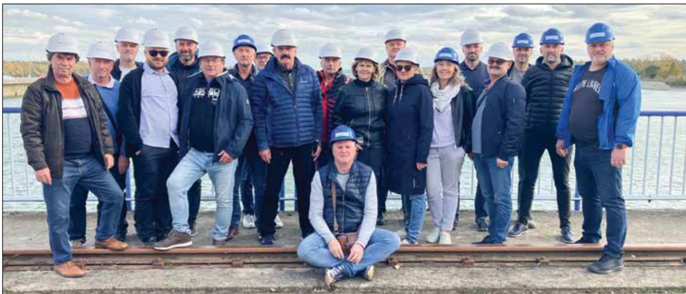
■ Spoločné pracovné stretnutie OIK Bohunice – OIK Mochovce a OBK Dukovany sa uskutočnilo 22. – 24. októbra 2025. Účastníci stretnutia navštívili vodné dielo Gabčíkovo, absolvovali plavbu cez plavebné komory a tiež prehliadku elektrárne. Na radnici v Gabčíkove ich prijali zástupcovia mesta.