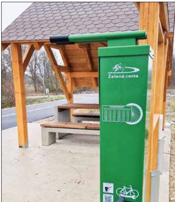
■ Združenie obcí Zelená cesta vzniklo zápisom do registra združení obcí dňa 17.5.2017. Základnou myšlienkou pre vznik bolo zabezpečenie spolupráce všetkých členov pri realizácii spoločného zámeru, a to osobitne v oblasti prevodu vlastníctva, prípadne nájmu stavby a príslušných pozemkov nevyužívanej železničnej trate č. 803 Piešťany – Vrbové od vlastníka Slovenská republika, v správe Železnice Slovenskej republiky a následné vybudovanie a prevádzkovanie tejto trasy ako cyklotrasy.

števňikov z celého Slovenska, čo prináša nové impulzy pre lokálne služby a rozvoj cestovného ruchu v povodí Holešky.