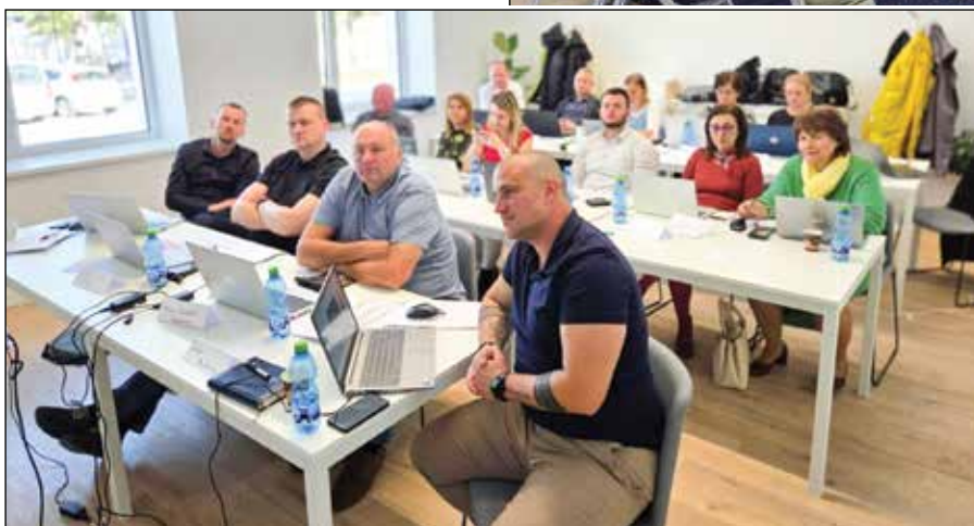
■ V zasadačke MsÚ Leopoldov sa 12.3.2025 uskutočnil seminár „Umelá inteligencia v praxi. Ako si uľahčiť prácu s využitím AI.“ Išlo o príjemný seminár v malej skupine, kde účastníkmi boli prevažne starostky/starostovia a všetci mali možnosť si priamo vo svojich PC vyskúšať prezentované informácie a mohli sa aktuálne pýtať na to, čo ich v danej oblasti zaujalo. AI je chciac-nechtiac súčasťou našich životov, a preto je potrebné i v tejto oblasti zdokonaľovať zručnosti.