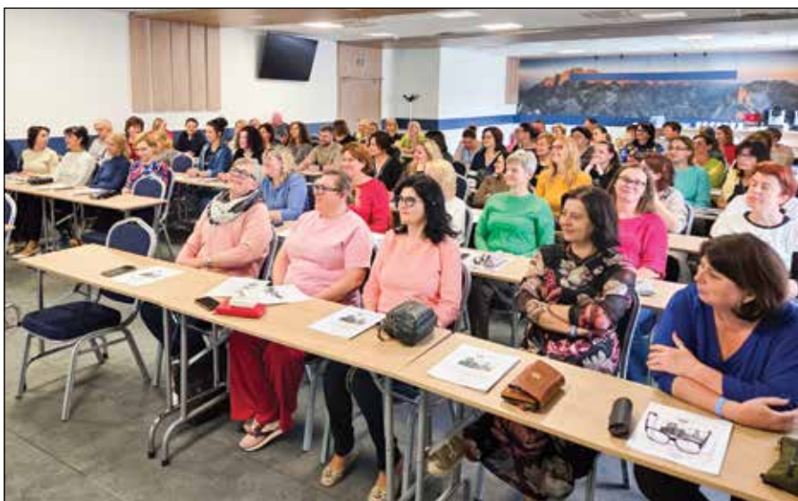
■ V Novom Smokovci sa v Hoteli Átrium v dňoch 19. – 21. mája 2025 stretlo 70 účastníkov na podujatí Profesionálny a osobnostný rast zamestnancov obcí. V príjemnom prostredí mali možnosť získať odborné vedomosti a množstvo informácií z výmeny skúseností a diskusie.

Spolu s kolegami z ďalších regionálnych vzdelávacích centier združených v Asociácii vzdelávania samosprávy sa usilujeme vyhľadávať nových lektorov, najmä odborníkov s praktickými skúsenosťami v oblastiach, ktoré zastrešujú. Zároveň identifikujeme aktuálne témy a hľadáme efektív-