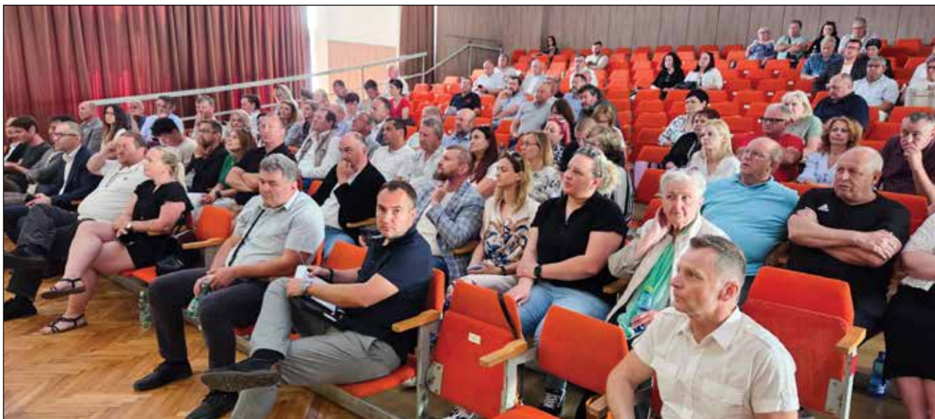
■ Prvé informačné stretnutie k založeniu združenia Samosprávna odpadová spoločnosť (SOS) sa konalo 4. júna 2025 v Kultúrnom dome Veľké Kostofany. Pozvaní boli zástupcovia samosprávy z regiónu ZMO ale i ďalšie samosprávy zo širšieho okolia. Predstavené boli hlavné ciele SOS a tiež postupné kroky prípravy založenia a následnej činnosti.

Zakladajúcimi členmi bolo 17 obcí a mesto Vrbové. Dnes združenie združuje už 52 samospráv a zastupuje takmer 92 500 obyvateľov . Ambíciou je do konca roka 2026 prekročiť hranicu 100 členských obcí a miest.