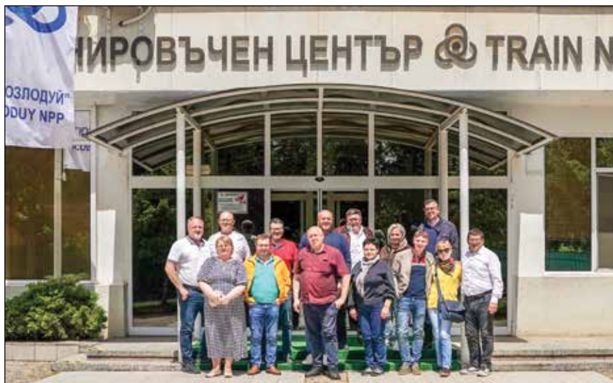
■ V rámci pracovnej cesty do Bulharska členovia OIK Bohunice navštívili i informačné a tréningové centrum operátorov jadrovej elektrárne

Prvý deň sa uskutočnil v Jaslovských Bohuniciach, ktoré sú historicky považované za kolísku československého jadrového priemys-