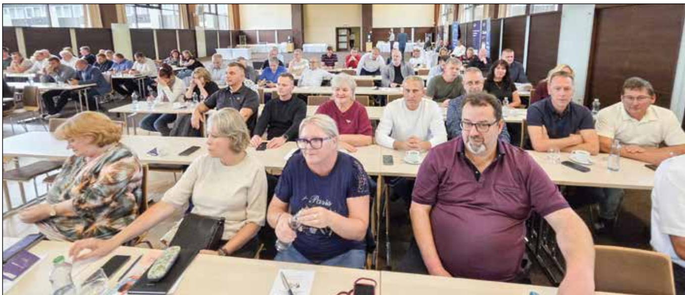
■ Podbanské, Grand hotel Permon 8. – 10. októbra 2025 – na pracovnom stretnutí dvoch najväčších regionálnych združení ZMO, región JE Jaslovské Bohunice a RZ Stredné Považie sa zišlo 190 starostov a primátorov