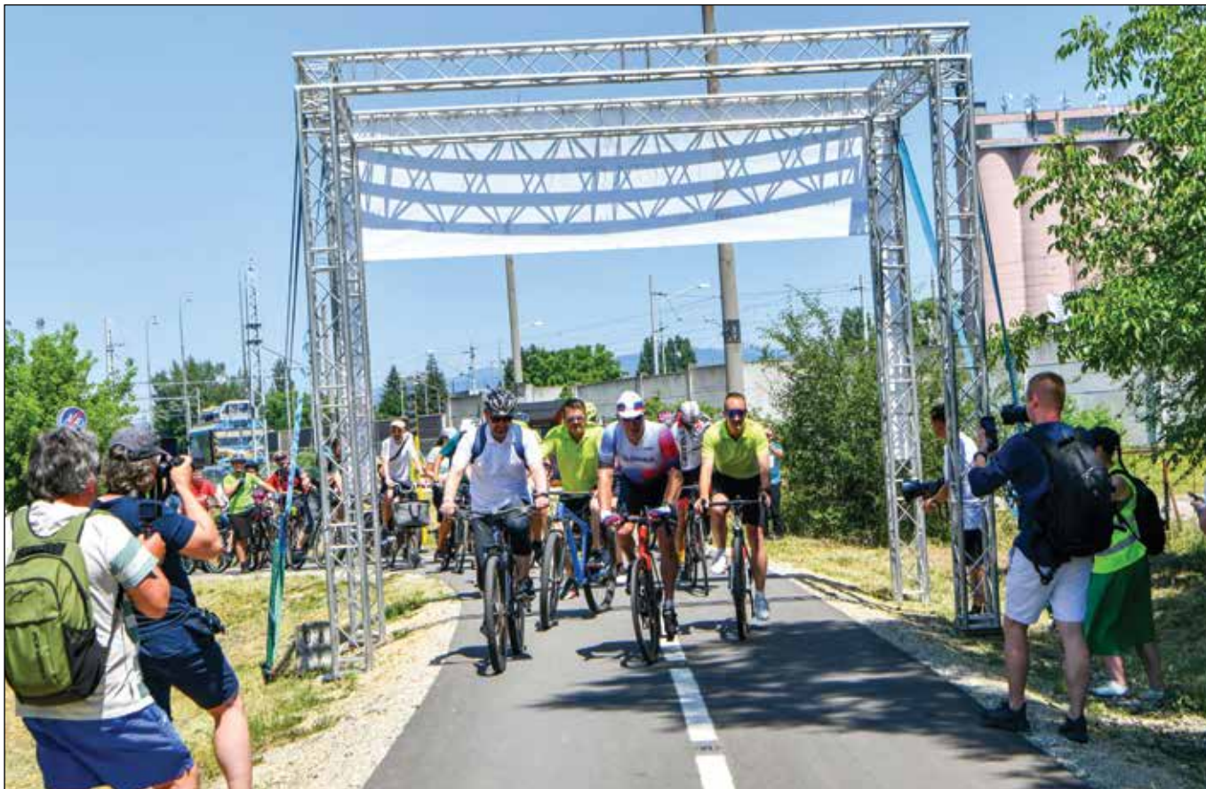
■ Jún 2025 – slávnostný štart po novej cyklotrase Zelená cesta v dĺžke 7,6 km

Tieto dáta jasne demonštrujú, že Zelená cesta je jednou z najvyťaženejších cyklotrás v Trnavskom kraji. Už po prvých mesiacoch užívania sa v rámci návštevnosti pohybovala na 2. – 3. mieste z 25 monitorovaných cyklotrás kraja.